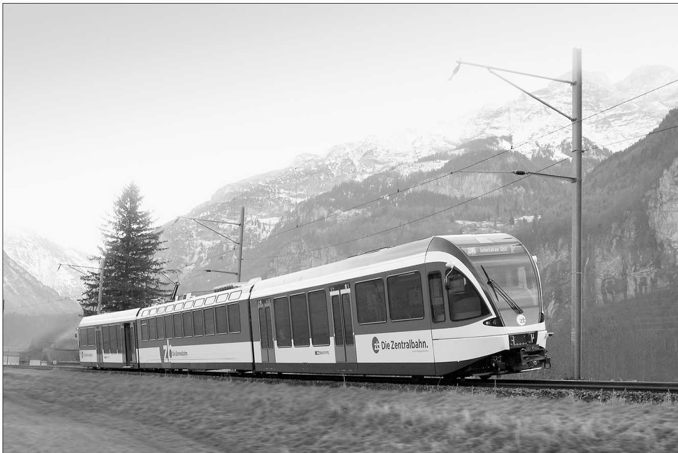
Рис. 2. Линия Brünigbahn

В будущем управление движением на участке Люцерн — Интерлакен будет осуществляться централизованно и в значительной мере в автоматическом режиме. Для этого на линии внедрены системы микропроцессорной централизации (МПЦ) SIMIS IS.