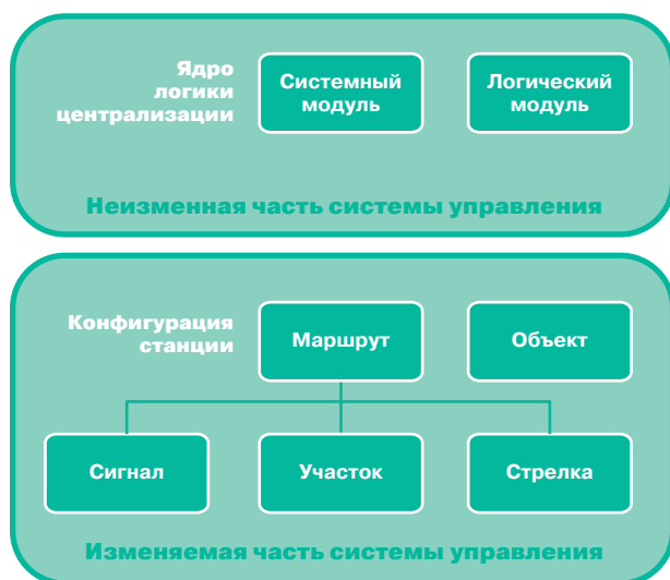
Рис. 4. Структура программного обеспечения МПЦ-МЗ-Ф

Такое разделение программного обеспечения микропроцессорной централизации позволяет значительно упростить внесение изменений, обусловленное корректировкой путевого развития станции. Применение системы автоматического проектирования (САПР) конфигурации станции позволяет существенно сократить срок разработки программного обеспечения для новых станций. Благодаря использованию САПР снижается риск внесения ошибки в программу на этапе проектирования, а также влияние человеческого фактора. В соответствии с установленным ОАО «РЖД» порядком Испытательный центр железнодорожной автоматики и телемеханики ПГУПС выдал заключение на технологическое ПО МПЦ-МЗ-Ф, подтверждающее безопасность его функционирования.