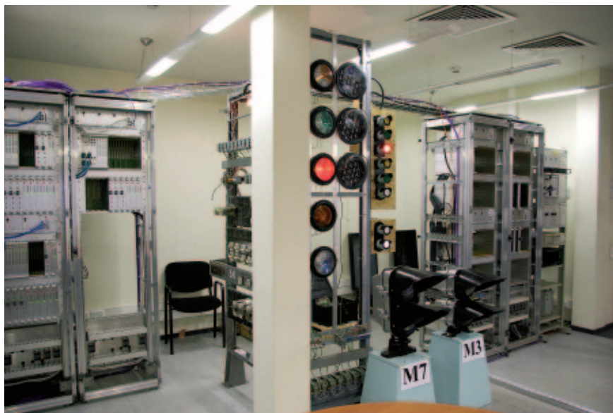
Рис. 6. Лаборатория ЗАО «Форатек АТ»

Обучение проводится в два этапа: в учебном центре ЗАО «Форатек АТ» и непосредственно на объекте внедрения (железнодорожной станции) с привлечением при необходимости отдельных сотрудников компании для более детального раскрытия конкретных технических или технологических вопросов.