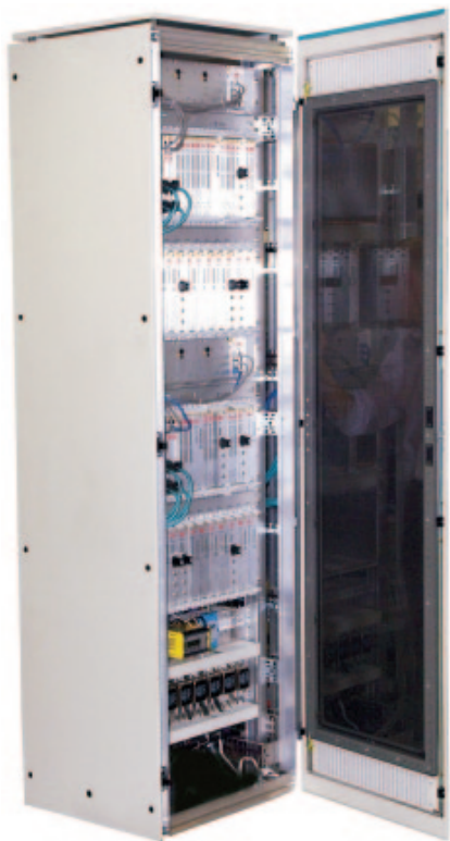
Рис. 3. Управляющий вычислительный комплекс МПЦ-МЗ-Ф

В состав УВК также входят модули увязки с напольными устройствами. Такое решение позволяет рационально использовать ресурс МПЦ. Например, для станции с числом стрелок порядка десяти требуется установка всего одного шкафа УВК.