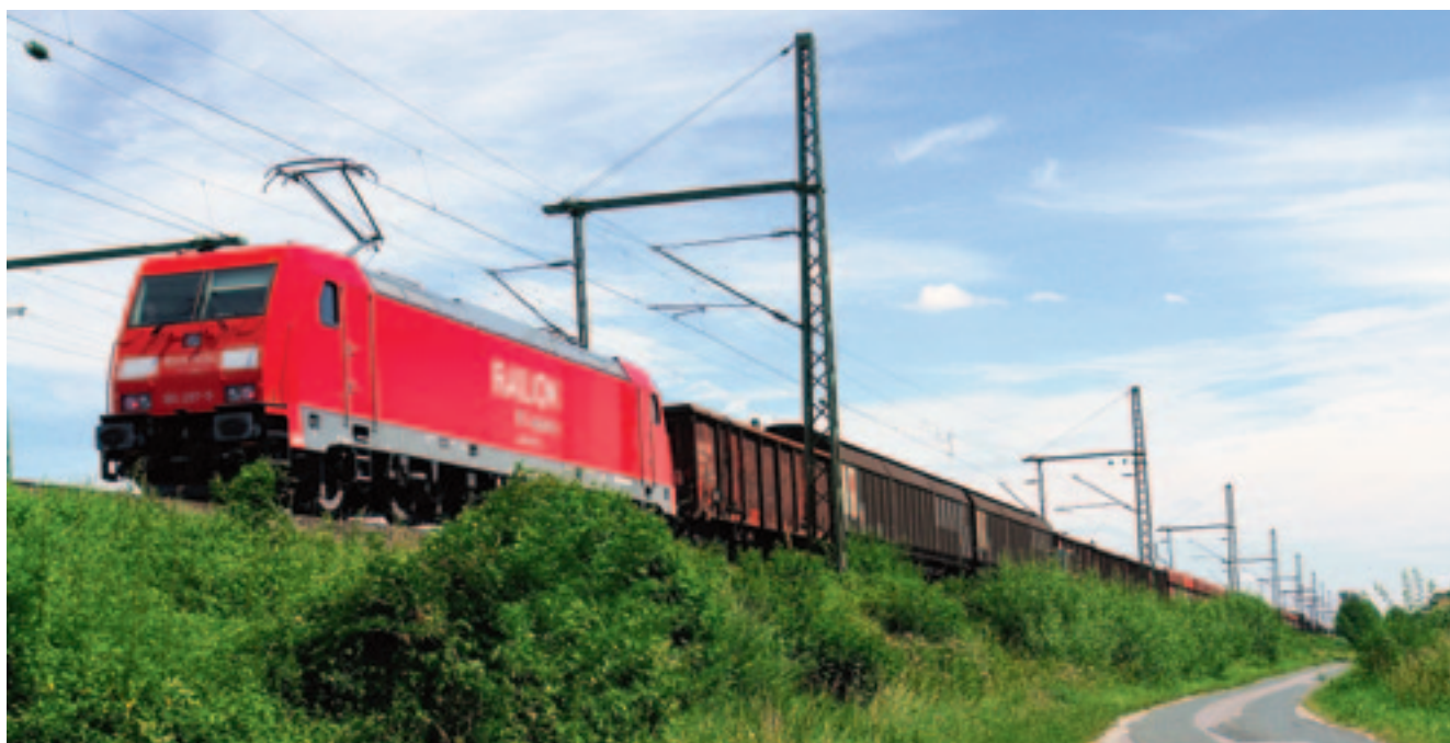
Рис. 1. Безопасный при столкновениях локомотив серии 185.2 (TRAXX F140AC2)

Единственным на тот момент действующим документом, определяющим безопасность при столкновениях, была «Техническая спецификация совместимости от-