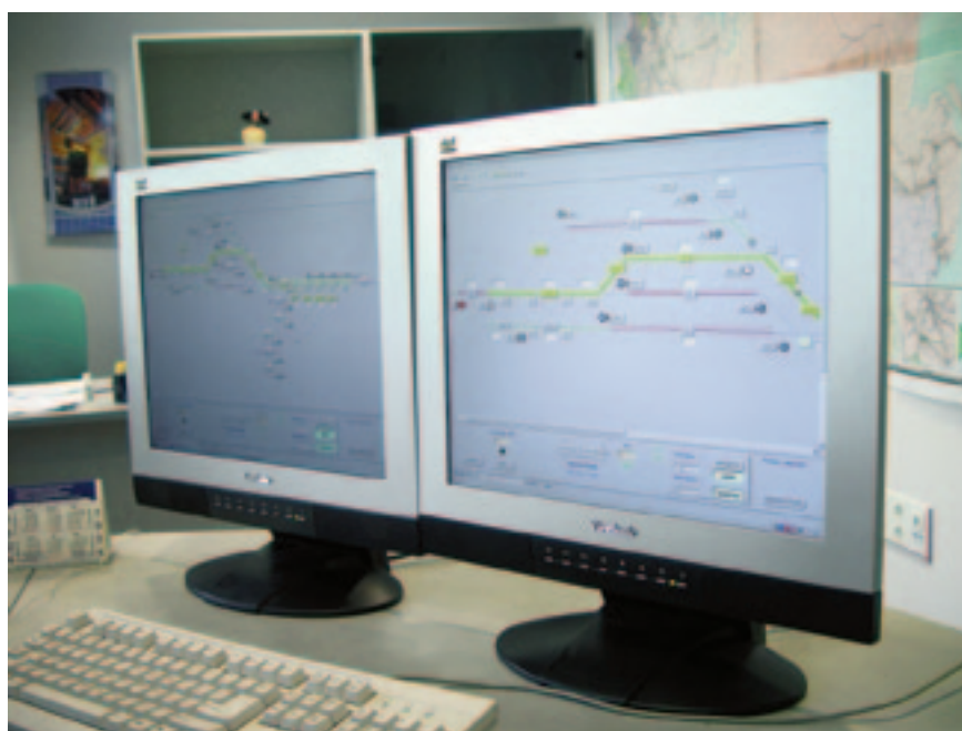
Рис. 3. АРМ дежурного по станции в МПЦ-И

Наряду с типовыми для данного вида систем СЦБ способами обеспечения безопасности в МПЦ-И заложен ряд дополнительных мер, направленных на повышение безопасности. Архитектура системы безопасности управляющего контроллера предусматривает двух- или трехканальный мажоритарный («2 из 3») варианты исполнения. Программно-технический комплекс МПЦ-И имеет сертификат соответствия в системе ГОСТ Р.