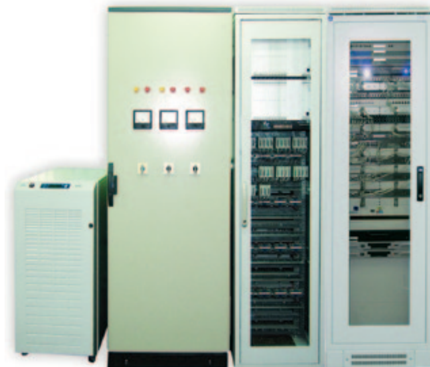
Рис. 1. Постовое оборудование МПЦ-И

По расположению аппаратуры система является централизованной — УКЦ, ШТК, релейные и кроссовые стивы, СГП-МС размещаются на посту централизации (рис. 1).