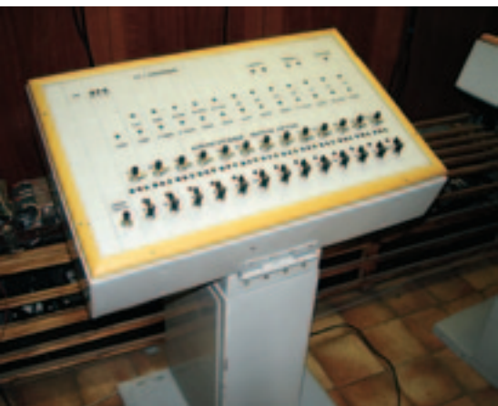
Рис. 4. Пульт резервного управления

Система МПЦ-И оснащена резервируемой системой управления и визуализации на базе компьютеров с клавиатурами и мониторами (либо проекционной установкой, в зависимости от размеров станции). При неисправностях управляющего контроллера централизации или АРМ дежурного по станции может использоваться пульт прямопроводного управления (рис. 4). В режиме резервного управления происходит аппаратное блокирование управляющих воздействий УКЦ.