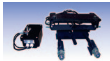
Рис. 3. Напольное оборудование системы ЭССО (слева — напольный электронный модуль, справа — рельсовый датчик)

С 1995 г. внедрено более 8000 счетных пунктов системы ЭССО