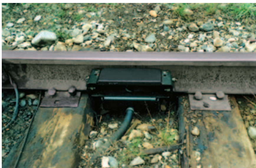
Рис. 2. Рельсовый датчик