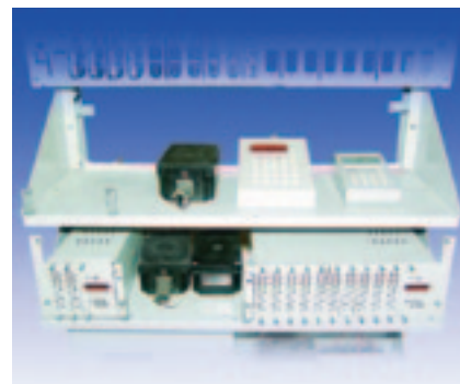
Рис. 4. Постовое оборудование системы ЭССО

на всех железных дорогах сети ОАО «РЖД» и на подъездных путях крупнейших промышленных предприятий России и ближнего зарубежья. За время их эксплуатации не произошло ни одного опасного отказа. На систему дается трехлетняя гарантия со дня ввода в эксплуатацию. Срок службы ЭССО составляет не менее 15 лет.